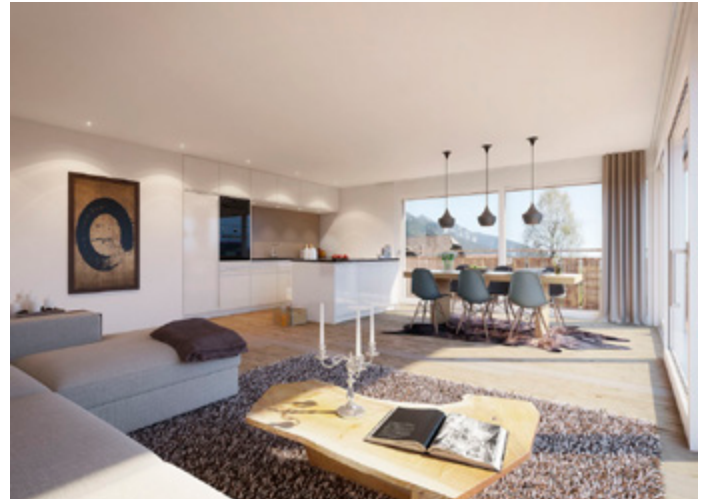
Die „Residence Dorfzentrum“ bietet eine einzigartige Wohnoase inmitten einer spektakulären Landschaft am rechten Thunerseeufer in Sigriswil